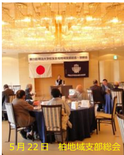
5月22日 柏地域支部総会

皆様ご存じの通り、令和2年2月頃から始まったコロナ感染が世界に広がり、日本においても社会全体が感染防止のために、諸制限・制約を行ってきました。令和4年に入り、新規感染者が減少傾向になり、徐々にコロナ禍前の社会状況に戻りつつあることから、懇親会を行