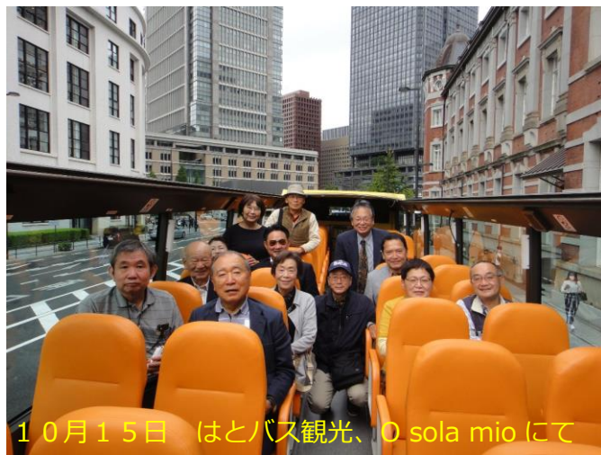
10月15日 はとバス観光、O sola mioにて