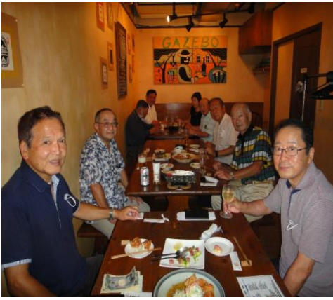
8月28日 納涼会(キッチンガゼボ)