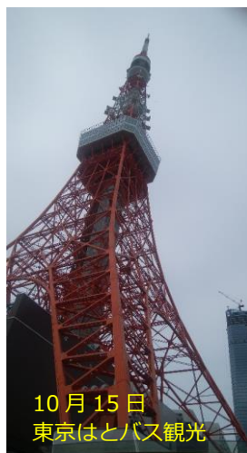
10月15日 東京はとバス観光

新年あけましておめでとうございます。会員の皆様におかれましては、ご健勝にて新年をお迎えのこととお慶び申し上げますとともに、今年が皆様にとりまして、幸多き年でありますようご祈念申し上げます。 その後もコロナ感染防止に留意しつつ、8月には「納涼会」を、10月には「はとバス観光」を実施してきました。