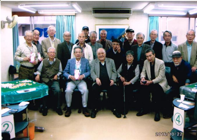
3地域支部合同麻雀大会 10月22日