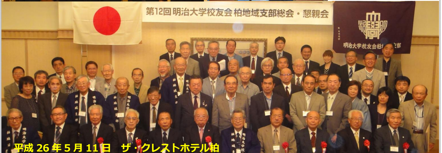
第12回 明治大学校友会 柏地域支部総会・懇親会