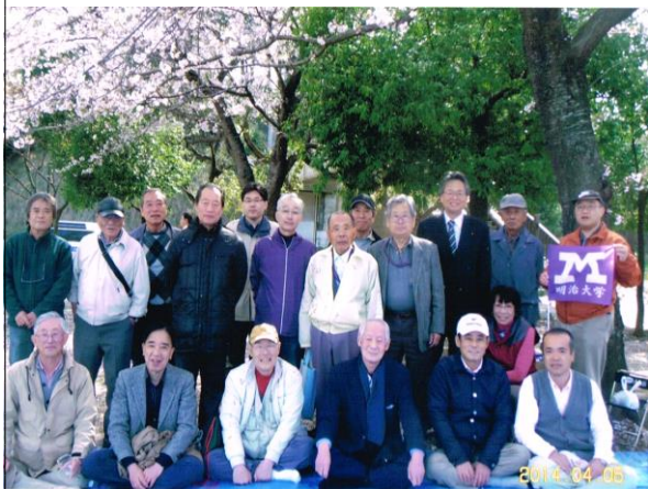
お花見会 柏ふるさと公園 (4月5日)

満開の桜に鋭気をもらい、質実剛健の意思を確認した懇親会でした。来年も元気で全員が揃う事を願う会でした。