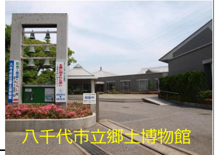
八千代市立郷土博物館

明治大学博物館や当館に限らず、身近にたくさんある博物館に、気軽にお出かけください。きつと、新たな興味を見いだせると思います。