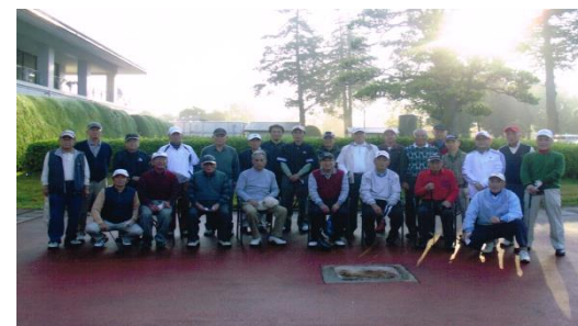
柏・我孫子・流山地域支部合同ゴルフ大会 紫カントリーコース 11月5日

うわあ、久しぶりの国立競技場、さすが伝統の明早ラグビー戦。満員、満員。学生たちの動員にける努力のあかしです。平成25年12月1日、現在の国立競技場では最