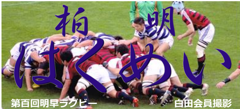
第百回明早ラグビー