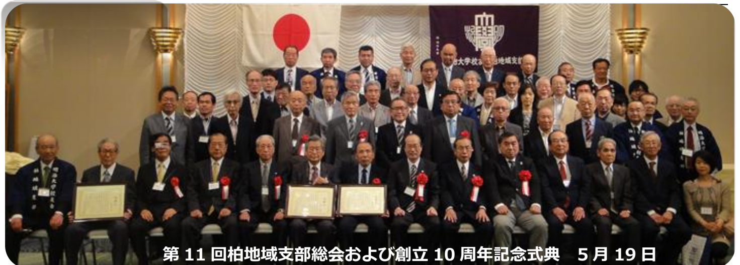
第 11 回柏地域支部総会および創立 10 周年記念式典 5 月 19 日